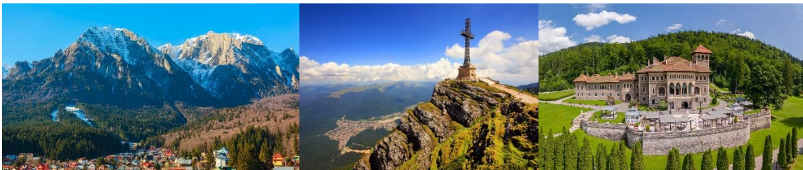
Buşteni, la Cruz de Caraiman dedicada a los héroes de la Primera Guerra Mundial, el Castillo Cantacuzino

11:30 – 12:30: Desplazamiento hacia Râşnov. El recorrido pasará por las estaciones de Buşteni y Azuga, situadas en las afueras del parque natural Bucegi, entre las estaciones de montaña más populares, ofreciendo panoramas espectaculares y una multitud de oportunidades para vacacionar, desde esquí hasta excursiones por la montaña. Râşnov, ubicado en la ruta comercial que atraviesa la cadena montañosa de los Cárpatos de Valaquia a Transilvania, fue originalmente una fortaleza daco-romana llamada Cumidava, y luego se construyó una fortaleza campesina que aún se mantiene en pie hoy, siendo una atracción turística importante (que no se visitará durante esta excursión).