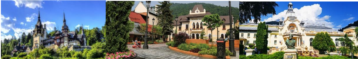
Castillo de Peleş, Ayuntamiento de Sinaia, Casino de Sinaia

El Castillo de Peleş está situado en la estación de Sinaia, la antigua residencia de verano de la familia real rumana, y actualmente alberga el Museo Nacional de Peleş.