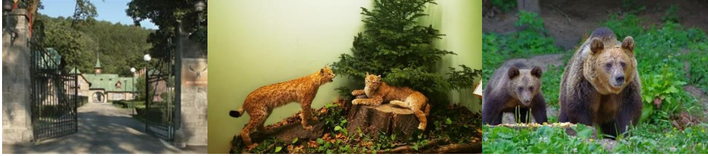
Posada – museo de la caza

09:00: Visita al museo de la caza de Posada – 30 minutos de visita.