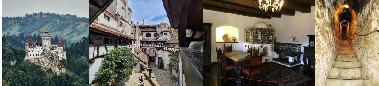
El Castillo de Bran

El Castillo de Bran, conocido mundialmente como el “Castillo de Drácula”, se transformó en residencia real en 1920. Actualmente, el museo de cuatro pisos alberga colecciones de muebles, trajes, armas y armaduras. El dominio de Bran también incluye el parque real con sus dos lagos, la casa de té, la casa del administrador y la casa de la princesa Ileana.