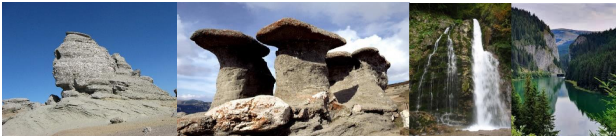
El Esfinge de Bucegi, Las Viejas (Babele), La Cascada Ruidosa (“Urlătoarea”), El Lago Scropoasa con la Garganta de Orza

07:00: Salida desde Bucarest hacia el Valle de Prahova, la zona turística más desarrollada y conocida de los Cárpatos, específicamente de las montañas Bucegi. Las montañas Bucegi están reconocidas como un parque natural destinado a la protección de grandes mamíferos (osos, lobos, lince, ciervos, gamuzas, etc.) y flores raras (edelweiss – Leontopodium alpinum Cass, zapato de Venus – Cypripedium calceolus , etc.), así como bosques antiguos. La estructura geológica, con una combinación de esquistos cristalinos, areniscas y calizas, permite la formación de formas de relieve espectaculares como concreciones, gargantas, cuevas, cascadas, lagos, etc.